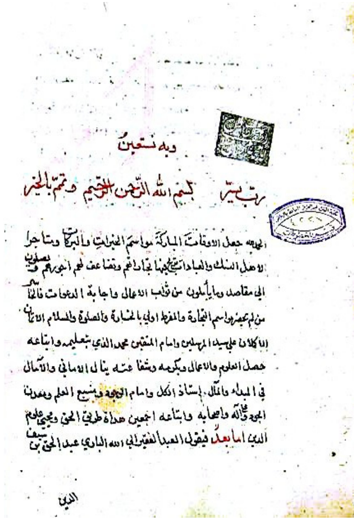
اللوحة الأولى من المخطوط