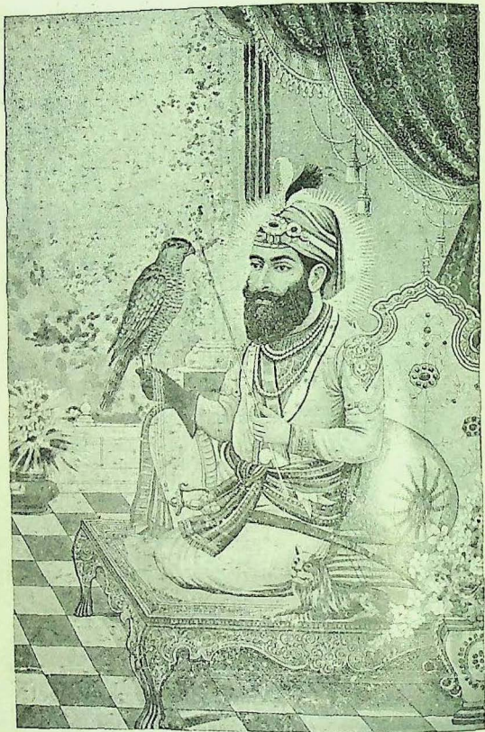
سري گورو گوبند سنگھ صاحب